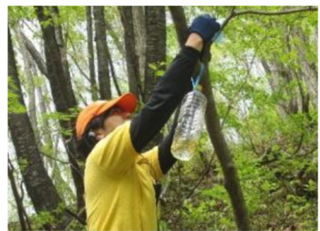
登山道に設置をしている様子