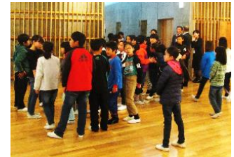
歓声をあげる児童の様子

オープニングセレモニーに続いてからまつ館の見学を行いました。からまつ館に足を踏み入ると、児童から歓声上がり、「明るい」「木の香りがする」といった声も聞かれました。