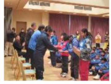
代表生徒から感謝状を贈呈しました！