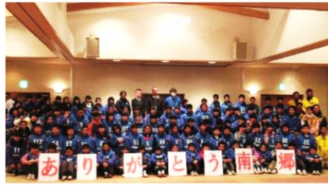
みんなで記念撮影「ハイ、チーズ！！」