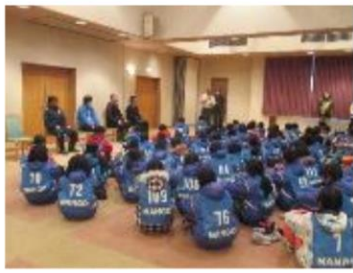
南郷の方々からご挨拶をいただきました！